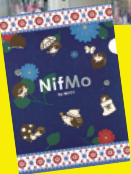
サンプルは全て福井本社でご用意しております!