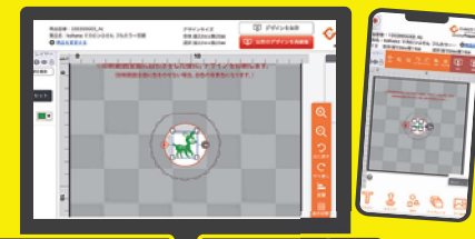
スマホやタブレットで簡単にデザイン!

一部商品には、WEBとスマホ・タブレット上で簡単にデザインが作れる無料サービス「デザつく」をご利用いただけます。お気に入りの写真や、スタンプ機能などを組み合わせ、御社だけのオリジナルデザインを作ることができます。