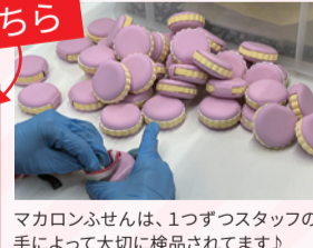
マカロンふせんは、1つずつスタッフの手によって大切に検品されています!